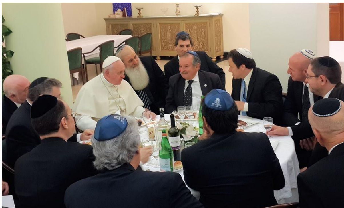
Francisco se complace en la amistad con la que lo honran los más acérrimos enemigos de Cristo.