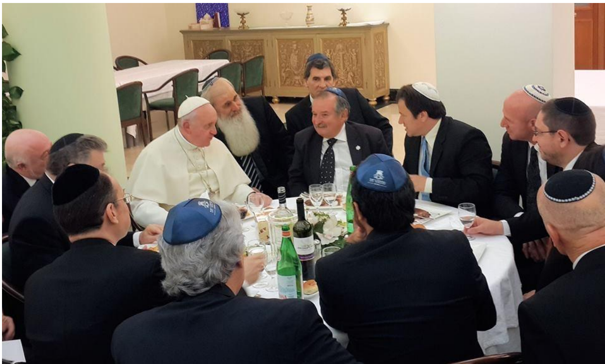
Francisco desfruta a amizade incondicional com que é honrado pelos mais encarniçados inimigos de Cristo.